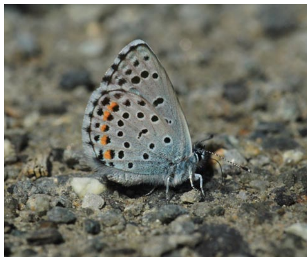
Obr. 5. Scolitantides baton , samec z lokality Nová Hůrka (11.VI.2014).

Fig. 4. Kepelské Zhůří, a locality with the highest elevation (930 m a. s. l.) of the currently known occurrence of Scolitantides baton in the Czech Republic.