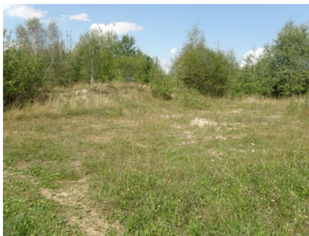
Obr. 3. Část lokality Klenová, kde byl Scolitantides baton pravidelně pozorován v sezónách 1990–1993.

Fig. 2. Habitat of Scolitantides baton at the locality Zámkovská hora hill.