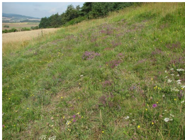
Obr. 2. Biotop druhu Scolitantides baton na lokalitě Zámkovská hora.

Areál bývalého tankodromu (Obr. 3). Druhová příslušnost prvního exempláře odchyceného na lokalitě byla během přípravy publikace KUDRNY (1994)