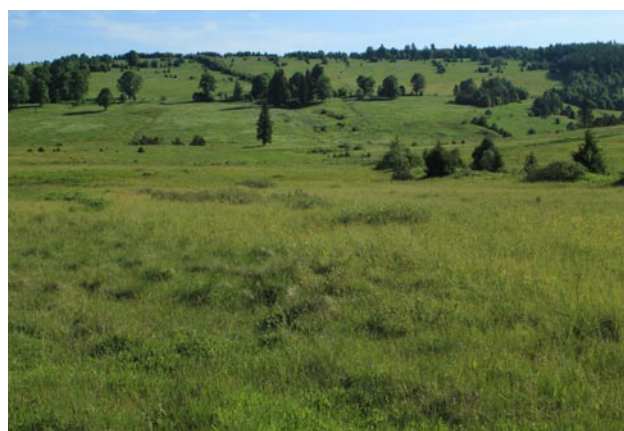
Obr. 4. Kepelské Zhůří, lokalita s nejvyšše položeným aktuálně známým výskytem Scolitantides baton v ČR (930 m n. m.).

Lokality rozmístěné podél cesty a bývalých rozjezdů pro obrněná vozidla na střešnicích se nalézají na území bývalé osady Stodůlky a v místech extenzivní pastvy ovcí na úklonech a svazích říčky Křemelné. Výskyt je jednotlivý, příznivý biotop zaujímá více než 10 ha. V enklávě se na některých místech negativně projevuje intenzivní pastva skotu a sukcese. Mikrolokality spolu mohou komunikovat i do budoucna, pokud bude blokována dřevinná sukcese a podporována extenzivní mozaikovitá pastva ovcí.