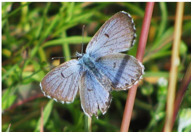
Obr. 1. Scolitantides baton , samec z lokality Zámkovská hora (20.VI.2009). Fig. 1. Scolitantides baton , male from the locality Zámkovská hora hill (20.vi.2009).

Bolešiny (6546), Zámkovská hora, 442 m n. m., 20.VI.2009, 1 ♂, M. & L. Bešta observ. (Obr. 1). Výchozy bývalého vápencového lomu přecházející v jihozápadně až jihovýchodně orientované stepní straně s bohatými porosty mateřídoušky (Obr. 2).